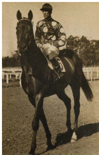
SCOOTER. Con el defensor del stud "General Rivera", la misma enseña del supercrack Uranio, logró la Triple Corona en la temporada de 1954.