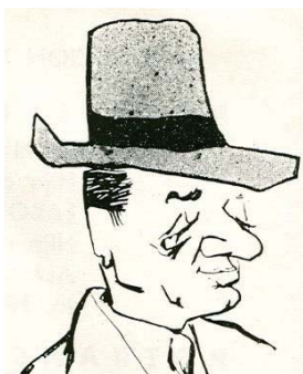
"Don Tito". Caricatura de la revista Turf y Crianza, N° 1 - 1953.

Fue uno de los principales y más reconocidos compositores del turf uruguayo. Durante más de cincuenta años de actividad ininterrumpida ocupó los lugares reservados para los mejores. No obstante ser uruguayo, sus comienzos en la cuida se remontan al año 1927 en la vecina orilla, después de incursionar como jockey-aprendiz en el hipódromo de La Plata. Cuidador exitoso de caballerizas de notable prestigio de Uruguay y Argentina, fue contratado para entrenar los representantes de la famosa caballeriza "Seabra" en Brasil.