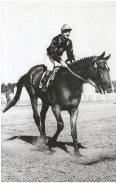
LOS CHURROS. Victoria en el "Carlos Pellegrini" de Maroñas en 1960 sobre Pantagruel y Baal.