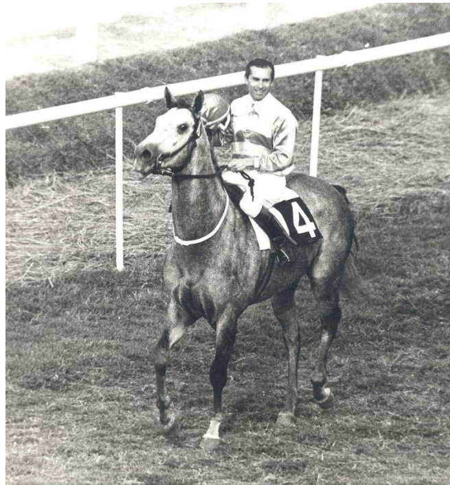
LEGENDARIO. Rumbo al podio ganador, tras su magnífica victoria en el "G. P. Presidente de la República" en Cidade Jardim, San Pablo, en 1976.

Sus hazañas también se extienden al exterior. Sus dos primeros éxitos fueron en Brasil. En 1974 ganó con Locomotor el clásico "Princesa do Sul" en la ciudad de Pelotas y en 1976 obtuvo con Legendario el "G. P. Presidente de la República" en Cidade Jardim, San Pablo. En esa ocasión el tordillo del stud "El Ranchero" venció en gran final a Suarelo, conformando el 1-2 uruguayo ante calificados representantes de Argentina, Chile y el local Brasil.