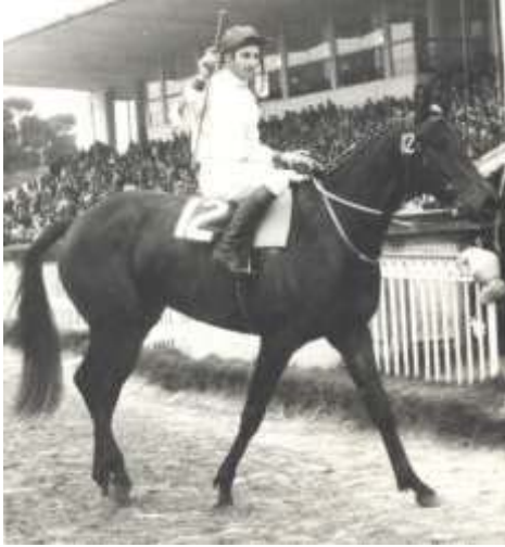
MON ARGENT. Victoria clásica con los colores del stud "11 de Agosto".

MON ARGENT. Antes, con Cherazada, de la caballeriza "Sopelino" entrenada por Félix A. Gómez, se había adjudicado el "G. P. Selección" de 1970. En 1969, con Campañera se impuso en el "Ciudad de la Plata" ("G. P. Ciudad de Montevideo desde 1983) con la preparación de Severino de Ferrari. En 1975, llegó al triunfo a Parpadeo, defensor del stud "Las Armas" al cuidado de Clemente Agüete, en el "G. P. de Honor".