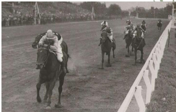
GRAN PREMIO MUNICIPAL, TRADICIONAL REVANCHA DEL "JOSÉ PEDRO RAMÍREZ".