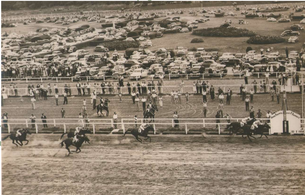
FINAL MEMORABLE. Luego de brava lucha de campeones, Aurreko consigue doblegar por ½ cuerpo a Euforión. Dos pingos de enorme clase brindaron uno de los finales más emocionantes en la historia del emblemático clásico, el más importante del calendario hípico maroñense.

noble Dinkie que, desde la salida, corrió en la vanguardia con parciales de excepción. Con su imposición, Aurreko dejó grabada la plusmarca de 3' 3", récord total y absoluto. "Es un gran caballo, se corrió mucho en todos lados y siempre venía fácil, aunque en la recta el de Ligugnana (refiriéndose a Euforión) no quería perder y debí extremar la exigencia", manifestó Gualberto Pérez su nuevo piloto.