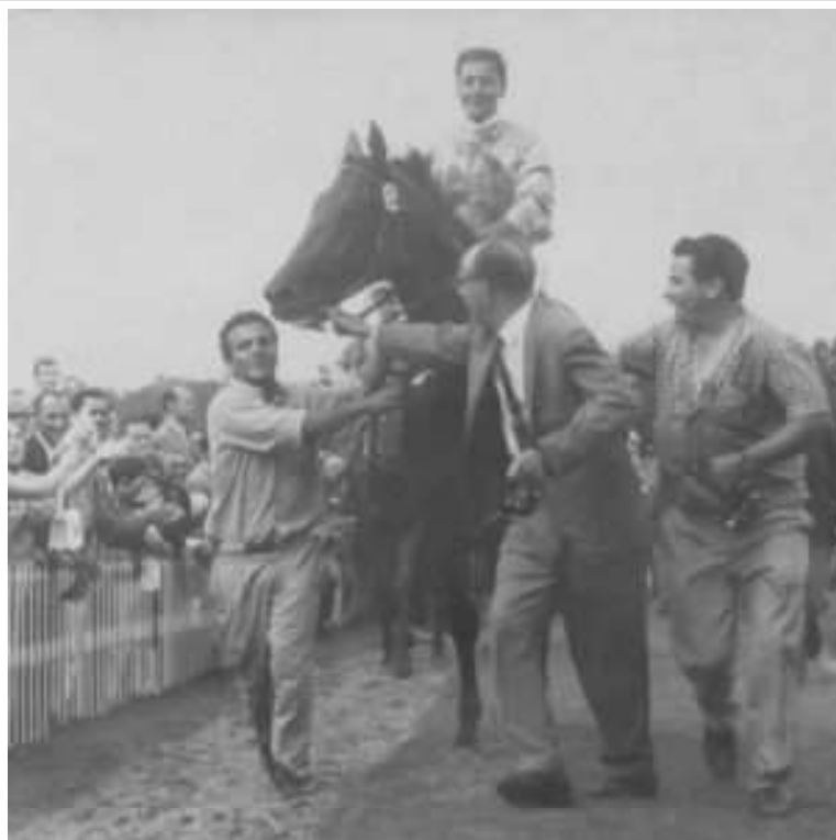
Sol de Noche ingresa victorioso después de ganar el G.P. Ramírez 1970

SOL DE NOCHE fue el héroe del Gran Premio. Como sucedió en el «Dardo Rocha» Yes Dear fue su más cercano escolta. Y como en aquella ocasión el hijo de Tapuíá no tuvo rivales.