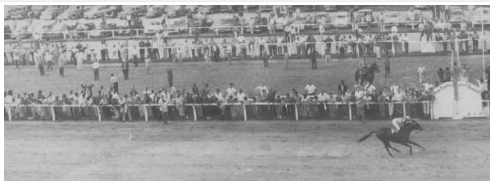
Llegada Sol de Noche G. P. Ramírez

Entonces, las añejas tribunas de Maroñas, colmadas como nunca, saludaron con una tremenda ovación la nueva demostración del crack.