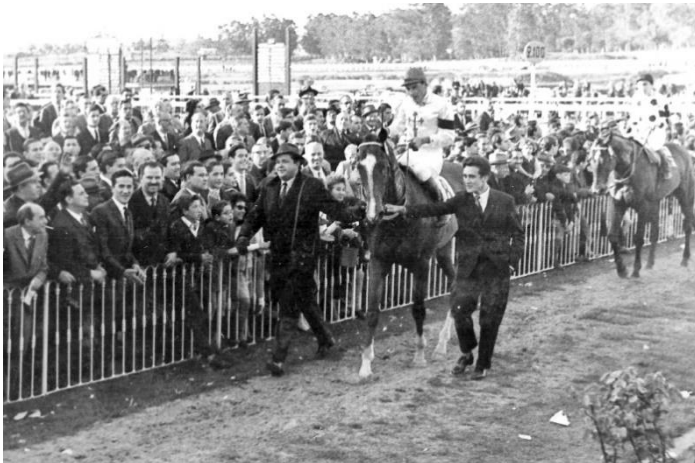
LOCOLOCO. El crack de las calzas blancas regresa al pesaje luego de vencer a Disparado en el "G. P. Jockey Club". El público observa el ingreso del guapo representante del stud "La Ilusión".