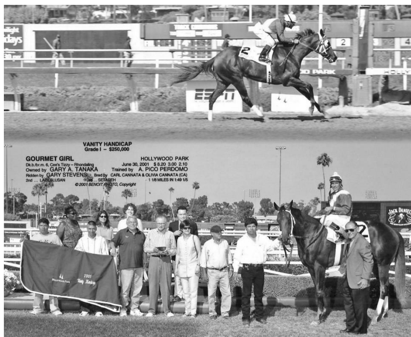
GOURMET GIRL. Victoria en el “Vanity Handicap” con el gran piloto Gary Stevens. De los mejores ejemplares a su cuidado: 9 triunfos, 7 segundos y 10 terceros puestos en 33 salidas a la pista, incluidos tres Grupo 1 en EE.UU.

En excepcional campaña, la estupenda Gourmet Girl le dio enormes satisfacciones, incluidos tres Grupo 1 con triunfos en la “Milady Breeder’s Cup” de 1999, “Apple Blossom” y “Vanity Handicap” en el año 2001.