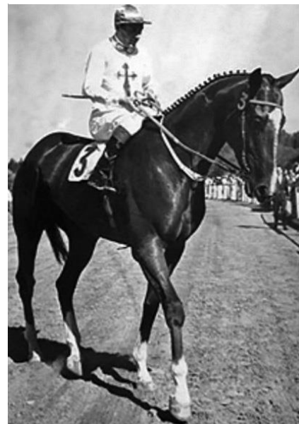
TRIPLECORONADO. Su jockey, Alcides "Pico" Perdomo".