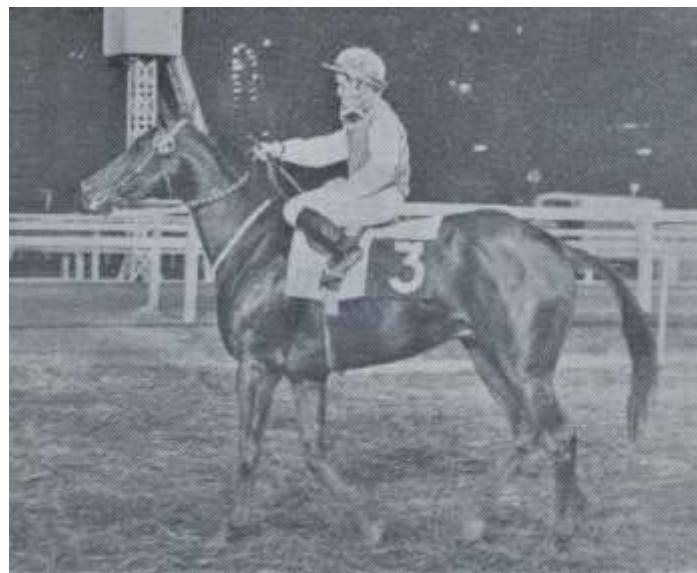
"MUÑECA". De regreso al recinto ganador en uno de sus triunfos internacionales en Cidade Jardim, San Pablo.