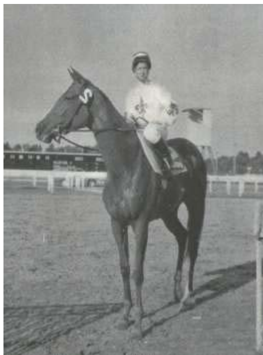
A LA CANCHA. Salida para el paseo preliminar en la arena del Hipódromo Argentino de Palermo.