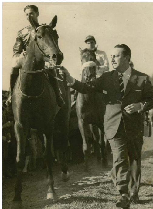
SCOOTER. Con el defensor del stud "General Rivera", la misma enseña del supercrack Uranio, logró la Triple Corona en la temporada de 1954.