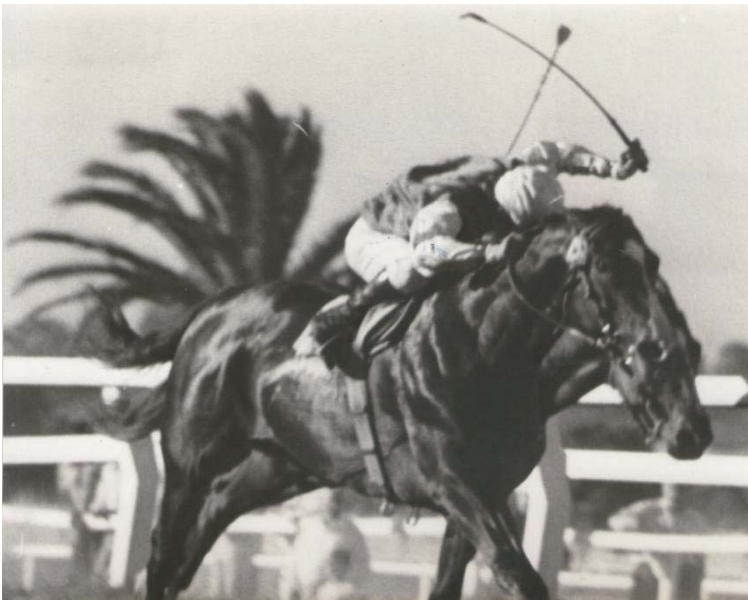
En una faena de antología, gana el “G. P. Benito Villanueva” en Maroñas en la tradicional jornada del 6 de enero de 1979.